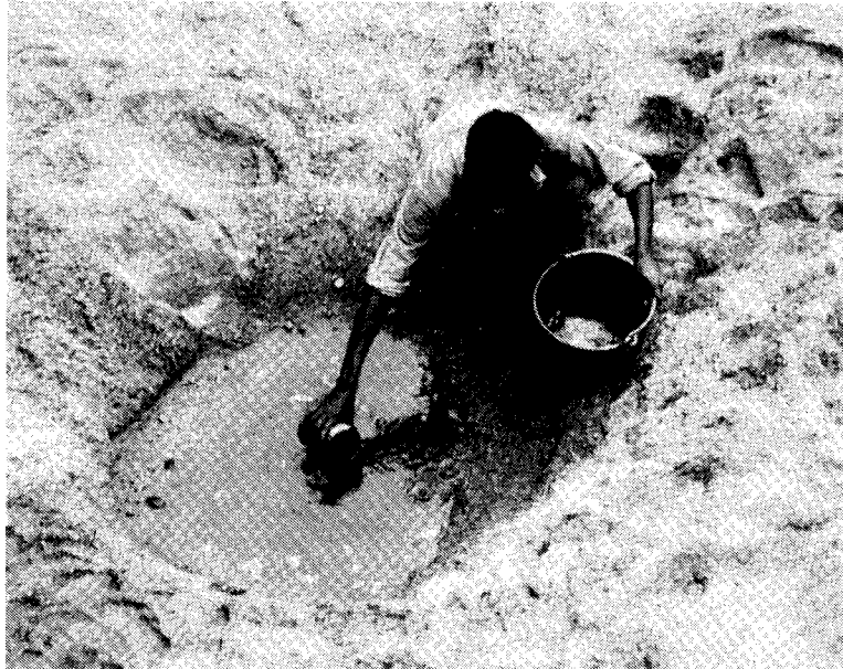
Äthiopier am Wasserloch

heit Frankfurts mit Entwicklungen in Südeuropa, der „Dritten Welt“ und in Afrika. 14 Ich will nicht bezweifeln, daß diverse Trinkwasserprobleme in entfernten Ländern indirekt einem Lebensstil geschuldet sind, den auch die breite Mehrheit der Frankfurter Bürgerinnen und Bürger bevorzugt. Ich bezweifle jedoch, daß derartige Bilder der lokalen Trinkwasserproblematik, die ich als Wassernot im Überfluß benennen möchte, gerecht werden.