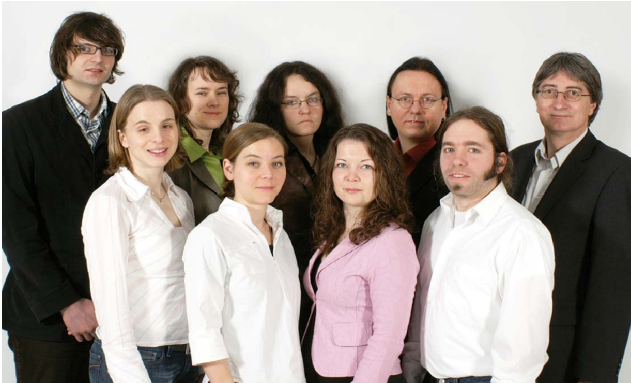
Abbildung 3: Das Projektteam des INCHER-Kassel im März 2009