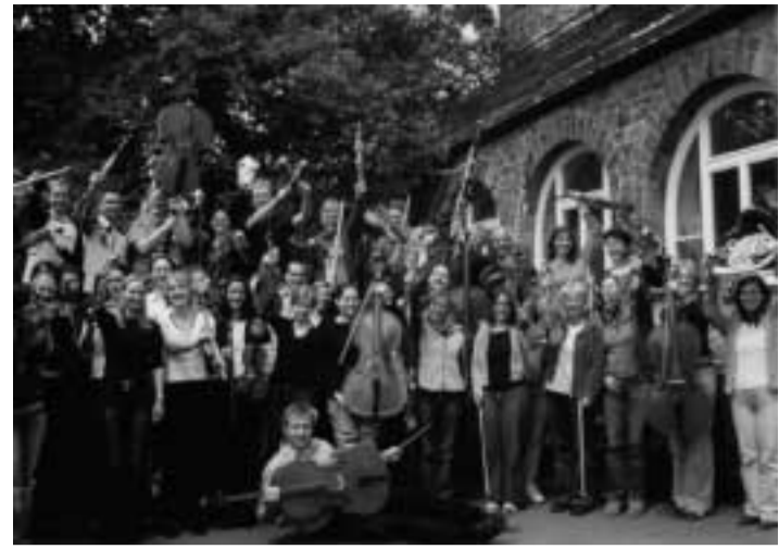
Das Orchester der Universität Kassel in Jubelstimmung.

Das Orchester wird zum Teil von der Universität Kassel und zum Teil über Spendengelder finanziert. Kontinuierliche finanzielle Unter-