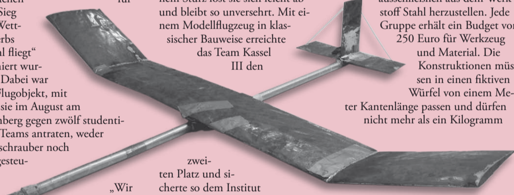
Siegreich durch Magnettechnik: Der Rohrrumpfflegler von Team Kassel I.

wiegen. Im Wettbewerb werden sie am Hang mit der Hand gestartet und müssen ihre Flugkunst unter Beweis stellen. Insgesamt vier Kasseler Teams waren in diesem Jahr dabei – es wird nicht einfach sein, ihren Erfolg 2008 zu wiederholen. P