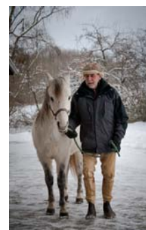
Führen eines Pferdes (auf Glatteis)