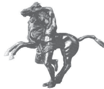
Statuette des jungen Alexander mit Boukephalos