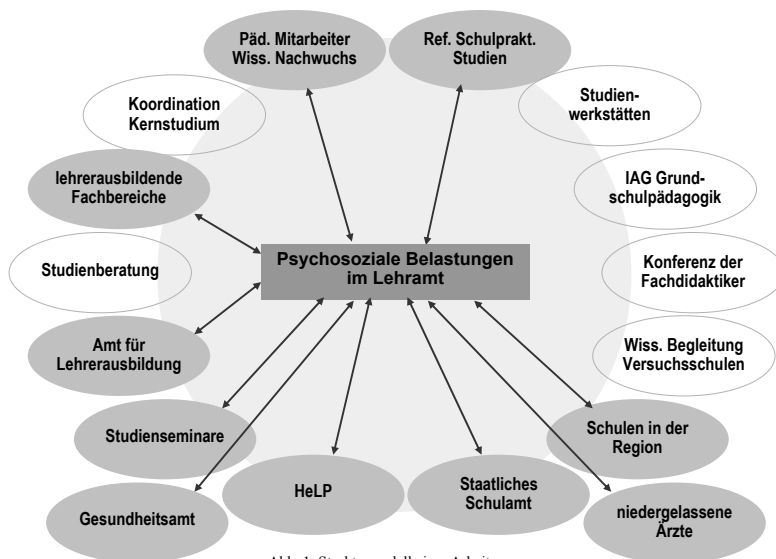
Abb. 1: Strukturmodell einer Arbeitsgruppe Abbildung aus dem Gründungsjahr der AG 2003