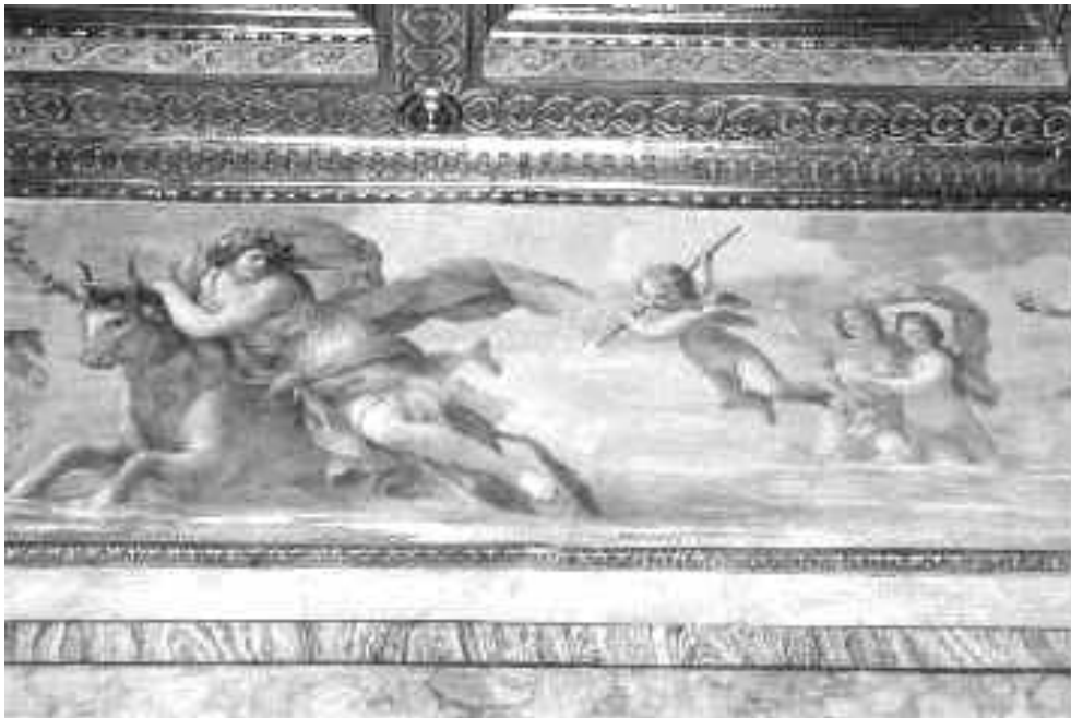
Palazzo Altemps, Rom. (vgl. http://lehrer.freepage.de/ianus/Seite8.htm )