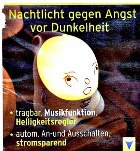
Abb. 14: Nachtlicht

Ein "schlaues" Licht bei Nacht, das Ihrem Kind beim Ein- bzw. Weiterschlafen hilft und nachts den Weg (z. B. zur Toilette) zeigt. Nach dem Einschalten wird das Licht allmählich gedimmt und schaltet sich nach 3, 10 oder 20 min (programmierbar) von alleine aus. Danach geht es automatisch an, sobald das Kind schreit oder das Nachtlicht anfasst. Mit Musikfunktion und Helligkeitsregler. Zwei 1,5-V-Batterien erforderlich (nicht enthalten). Sehr sparsam. Robuster Kunststoff.