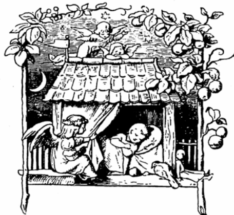
Abb. 2: Engel beschützen ein schlafendes Kind