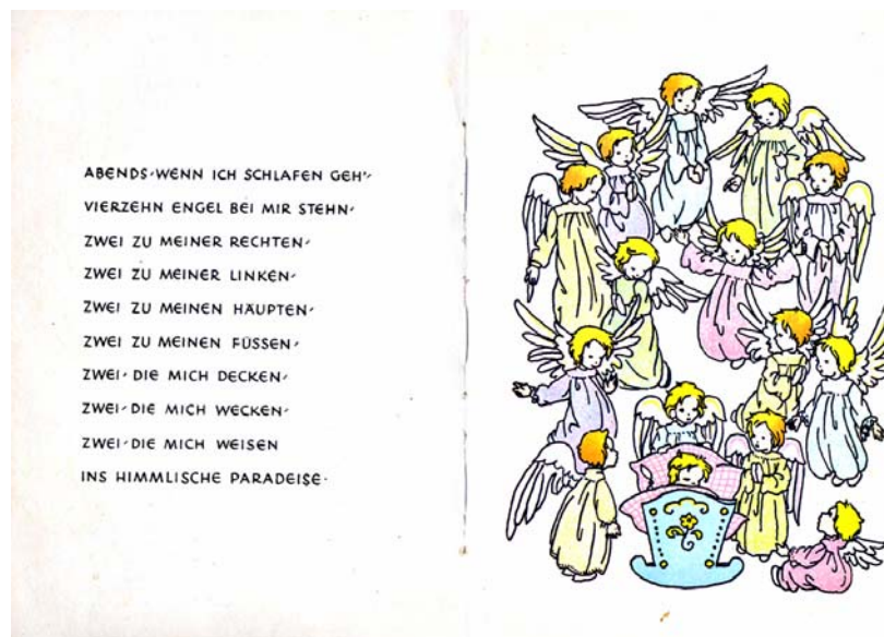
Abb. 3: Kindergebet mit bildlicher Darstellung

Quelle: Pfennigstorff, Marianne (1986) Lieber Gott nun schlaf ich ein – Kindergebete , Herrsching, S. 7,8