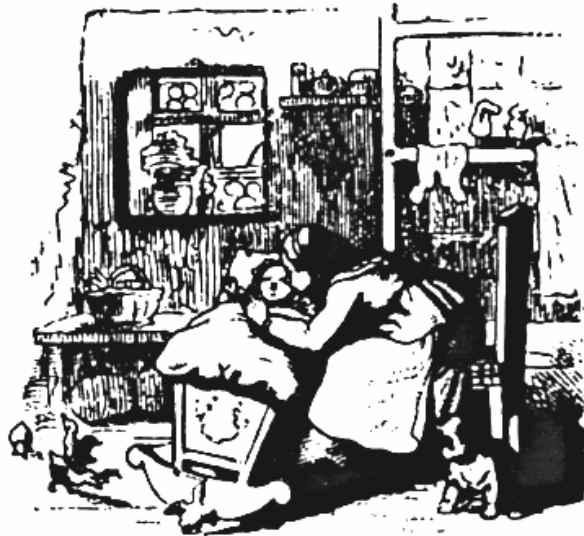
Abb. 5: Bild einer wiegenden Frau

Quelle: Bogner, Ute (1989) Die schönsten Kinderreime, Herrsching, S. 311