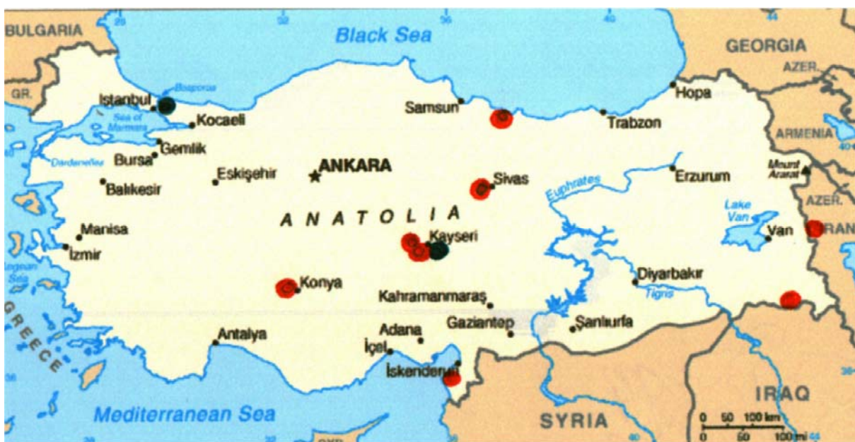
Abb. 10: Herkunft der Interviewpartner mit Migrationshintergrund 212

Zusätzlich zu diesen Größen galt es besondere Merkmale bei der Interviewgruppe mit Migrationshintergrund, wie den Herkunftsort im Heimatland, die Zugehörigkeit zu einer bestimmten ethnischen Gruppe in der Türkei sowie die Aufenthaltsdauer in Deutschland zu berücksichtigen. Die befragten Interviewpartner mit Migrationshintergrund leben bereits längere Zeit in Deutschland, zum überwiegenden Teil mehr als 20 Jahre. 210 Alle interviewten Kinder sind in Deutschland geboren. 211