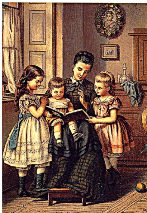
Abb. 7: Vorlesende Mutter (F. Brückner um 1860)