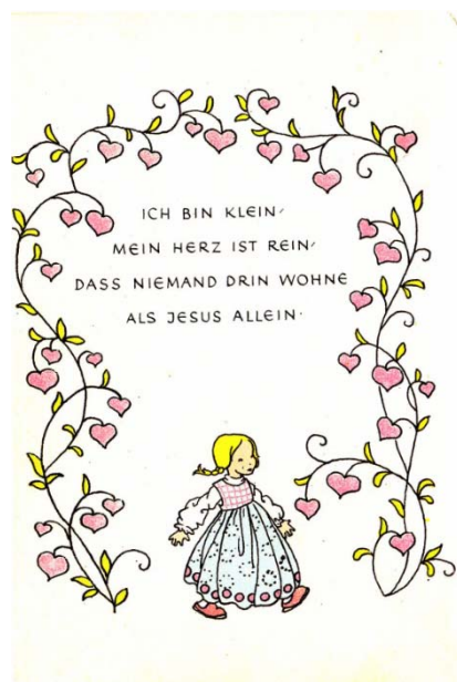
Abb. 11: Kindergebet mit Illustration

Quelle: Pfennigstorff, Marianne 1986 Lieber Gott nun schlaf ich ein – Kindergebete Herrsching , S. 26