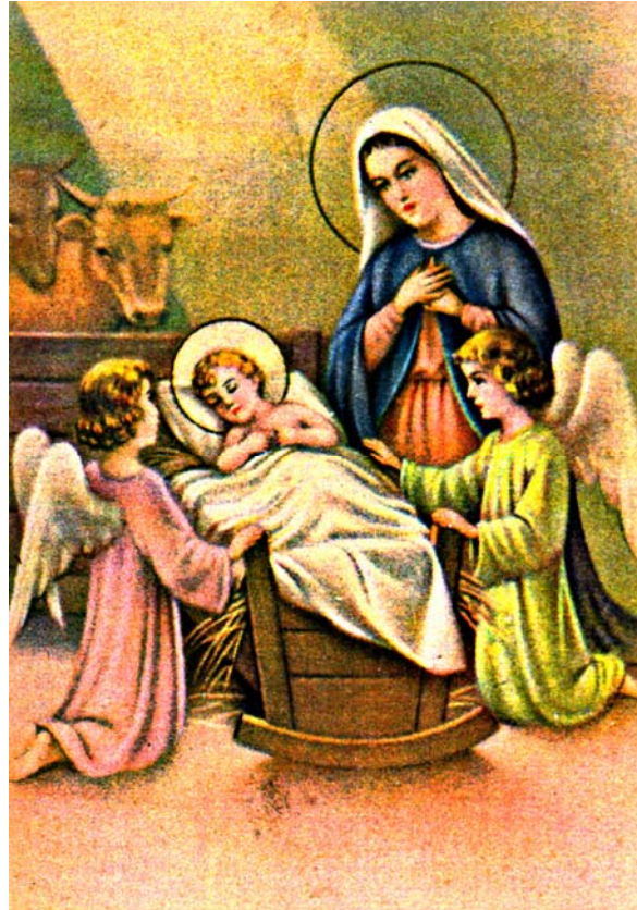
Abb. 4: Spanische Postkarte mit Maria, die an der Wiege des Jesuskindleins kniet

Die Abbildungen 4 und 5 sind Wiegenszenen gewidmet. Auf einer spanischen Postkarte kniet Maria an der Wiege – nicht an der Futterkrippe, wie im biblischen Text angegeben – des Jesuskindes. Die Heiligenscheine über Maria und dem Kind unterstreichen deren Bedeutung. Zwei kindliche Engel übernehmen die Aufgabe des Kindelwiegens, indem sie das Bettchen bewegen.