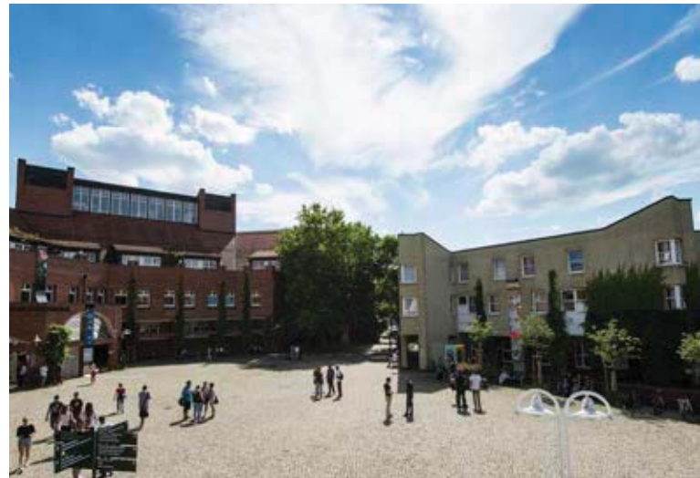
Universität Kassel: Campus Holländischer Platz

Mit der UNIKAT-Crowdfundingplattform hat die Universität Kassel als erste deutsche Hochschule eine eigene Crowdfundingplattform sowohl für Start-ups als auch für Projekte ohne unmittelbare Gründungsabsicht umgesetzt.