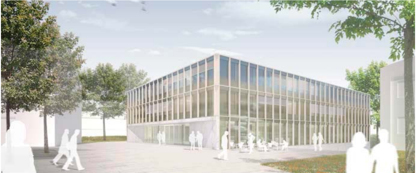
Science Park Kassel