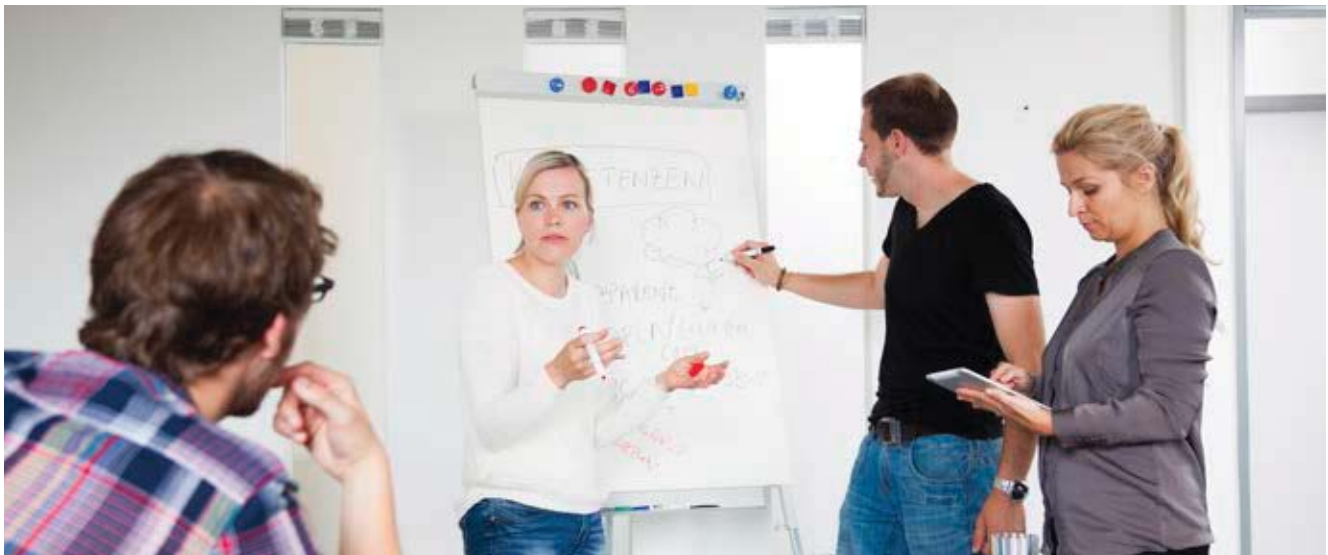
Gründerinnen und Gründer an der Universität Kassel

Die Ideenwerkstatt MACHEN! wird seit dem Wintersemester 2014/2015 im Fachbereich Ökologische Agrarwissenschaften angeboten: als Pflichtveranstaltung für die Studierenden des englischsprachigen Masterstudiengangs „International Foodbusiness and Consumer Studies“. Der Fachbereich gehört zu den gründungsstärksten in Kassel. Aufgrund seiner einzigartigen Stellung in der deutschen und internationalen Hochschullandschaft verzeichnet er einen zunehmenden Anteil ausländischer Doktoranden. Und genau die werden nun auch mit dem akademischen Gründergeist bekannt gemacht: Bereits zum zweiten Mal haben sie die Möglichkeit, in Zusammenarbeit mit dem Deutschen Akademischen Austauschdienst (DAAD) am