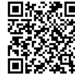
QR-Code zur PRONET 2 Homepage