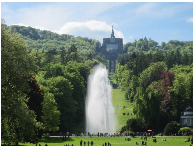
Abbildung 1: Der Tourismusmagnet in Kassel: Die Wasserspiele im Bergpark Wilhelmshöhe

Der empirische Grundpfeiler des Projektes bildet eine Befragung von Besuchern Kassels. Diese Befragung ist zweistufig aufgebaut. In einer Vor-Ort-Befragung an touristischen Schwerpunkten in Kassel werden zunächst Besucher zu grundlegenden Informationen ihrer Reise (wie dem Anreiseverkehrsmittel) sowie soziodemografischen Merkmalen befragt. Zwei verhaltenshomogene Personengruppen werden anschließend ein bis zwei Tage später erneut telefonisch zu ihrem konkreten Mobilitätsverhalten an dem Urlaubstag befragt. Insgesamt sollen aus jeder Personengruppe mindestens 225 Personen befragt werden. In einer ersten Erhebungswelle im September und Oktober 2020 konnte die Hälfte der gewünschten Stichprobe erhoben werden. Eine zweite Erhebungswelle wird im ersten Halbjahr 2021 durchgeführt.