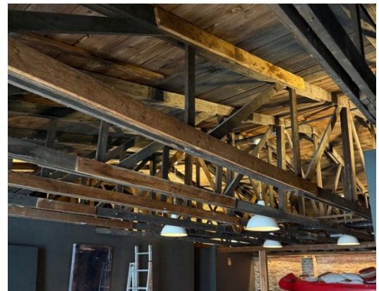
Abb. 3: Provisorische Instandsetzungsmaßnahmen

In der vertieften Untersuchung wurden FE-Modelle verschiedener Zustände analysiert. Bereits im ungeschädigten Zustand zeigten sich unter Berücksichtigung von Exzentrizitäten und Nachgiebigkeiten statische Defizite infolge der schlanken Trägerausbildung, insbesondere Stabilitätsprobleme durch Knicken von Obergurt und Streben sowie ein Versagen des Untergurts infolge von Zug und Biegung. Die Analyse des Ist-Zustands berücksichtigt Schäden in Anschlüssen und Bauteilen sowie bereits umgesetzte provisorische Instandsetzungsmaßnahmen. Die Ergebnisse bestätigen die Defizite des ungeschädigten Zustands und zeigen deren Verstärkung infolge schadensbedingter Lastumlagerungen.