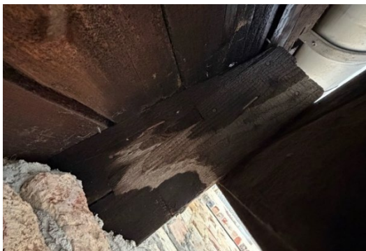
Abb. 2: Fäulnis im Fußpunkt des Fachwerkträgers

Bei der Bestandsaufnahme wurden mehrere Schäden festgestellt. In den Anschlussbereichen traten überwiegend Risse im Mittelholz zweischnittiger Nagelverbindungen auf, die mittels detaillierter und konservativer Methode bewertet wurden. Weitere Schäden umfassen fehlende Bauteile, Risse in den Stoßbereichen des Ober- und Untergurts, Ausbeulungen im Untergurt sowie Fäulnis in den Fußpunkten durch unzureichenden Witterungsschutz.