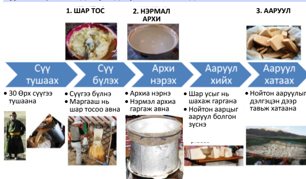
Зураг 5. Цагаан идээ үйлдвэрлэлийн шат дамжлага