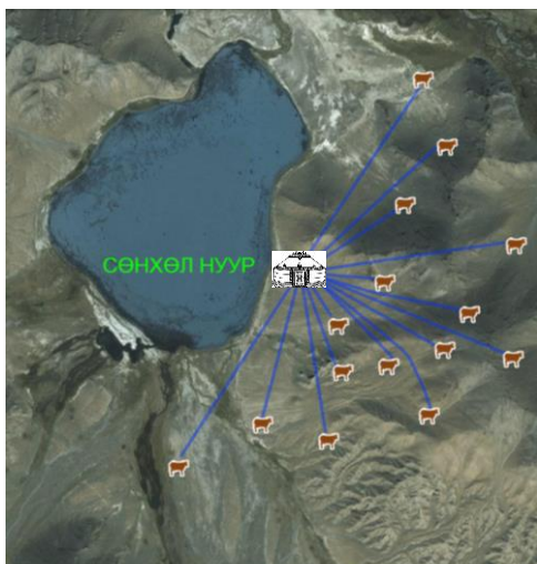
Зураг 4. Цагаан идээний хоршооны байршил