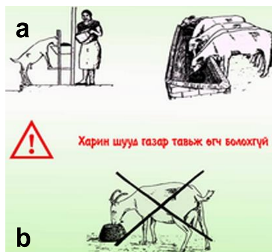
Зураг 5. а) Тэжээлийг хайрцаганд хийж долоолгож байгаа нь, б) Тэжээлийг шууд газар дээр тавьж өгч болохгүй.

Шахмал тэжээлийг мал амьтанд томоор үмхүүлэхгүй, зөвхөн долоолгохын тулд бага зэрэг том хэмжээтэй хайрцаганд хийнэ. Мал шахмал тэжээлийг үе үе бага багаар долооно. Тэжээлд давсны орц их байх учраас идэмж нь хязгаарлагддаг. Мөн тэжээлийг шууд газар дээр тавьж өгч болохгүй.