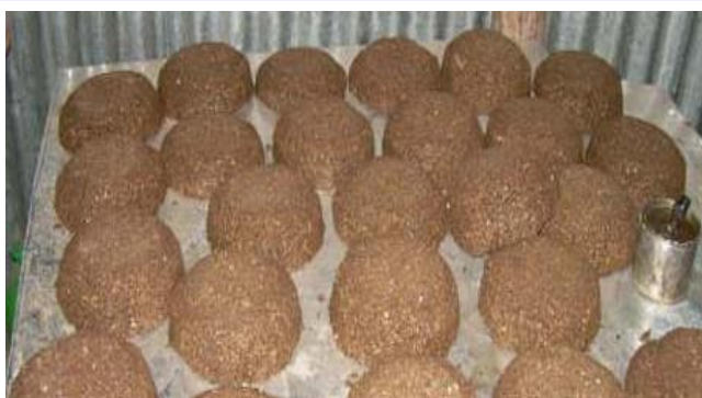
Зураг 1 Уураг эрдсийн шахмал тэжээл

Энэхүү тэжээлийг дан бэлчээрт буй хонь, ямаа, үхэр зэрэг хивэгч малд өвөл хаврын улиралд, мөн байран маллагаатай малыг чанар муутай бүдүүн тэжээлээр тэжээх үед нэмэгдэл болгон ашигладаг.