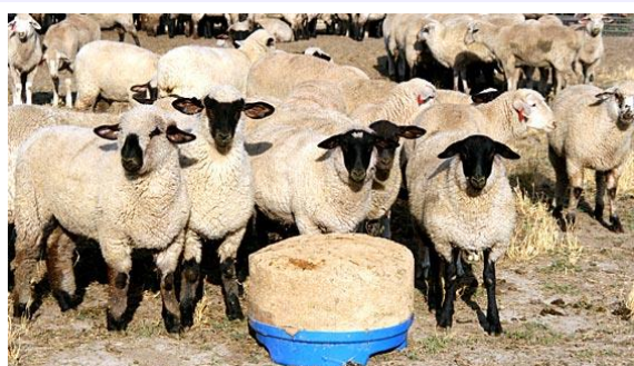
Зураг 2 Хурга долооц долоож байгаа нь