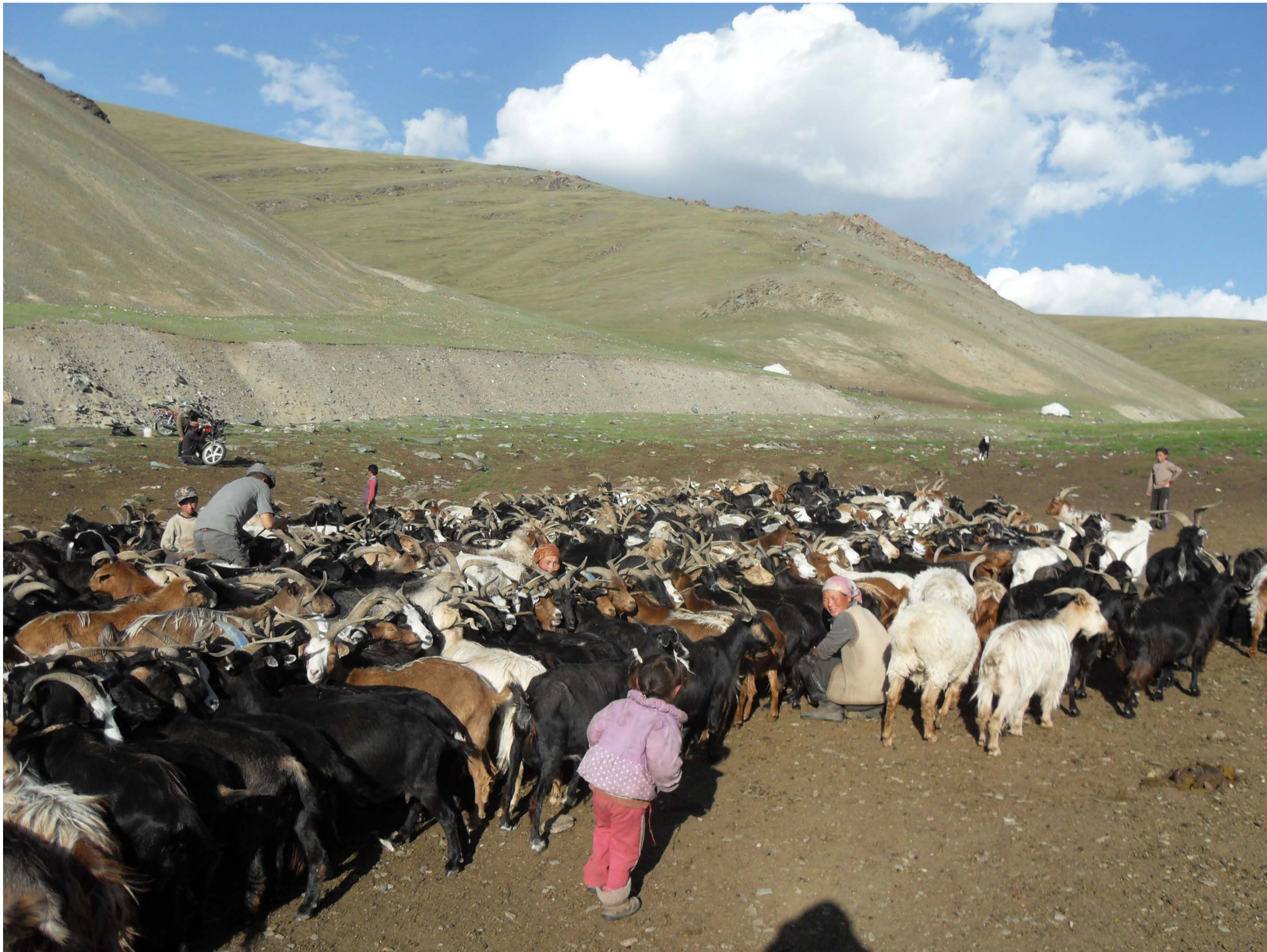
Зураг 1. Дээд нарийний зуслан, судалгааны айл ямаа саах үед