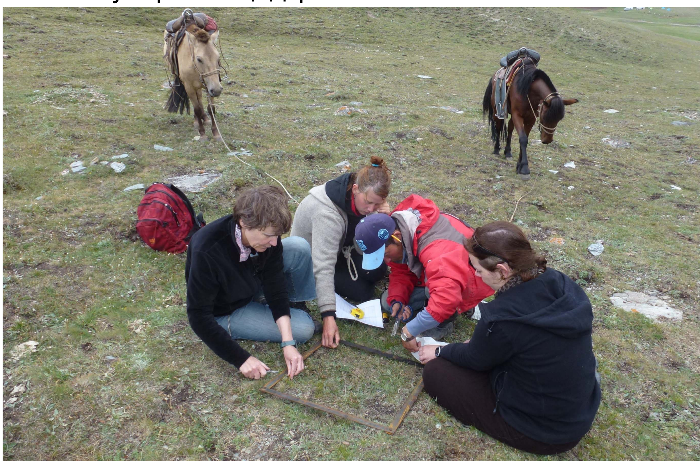
Зураг 2. Бэлчээрлэлтийн маршрутын дагуух бэлчээрийн ургамлын үнэлгээ хийж байгаа нь