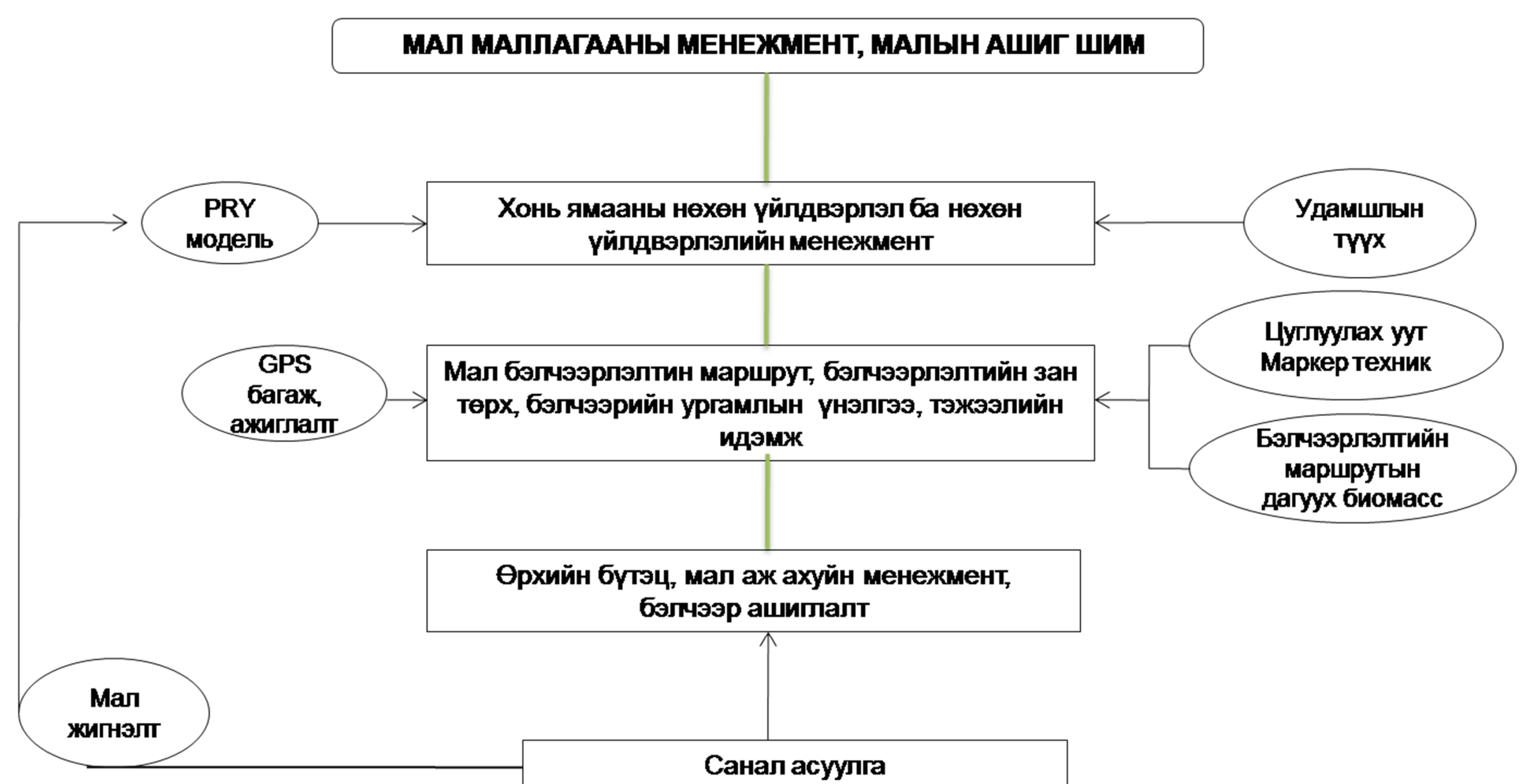
Зураг 3. Судалгааны материал цуглуулах арга ба докторын ажлын үндсэн бүлгүүд (зууван хүрээнд), дээжний бшинжилгээни үр дүнгүүд (дөрвөлжин хүрээнд)