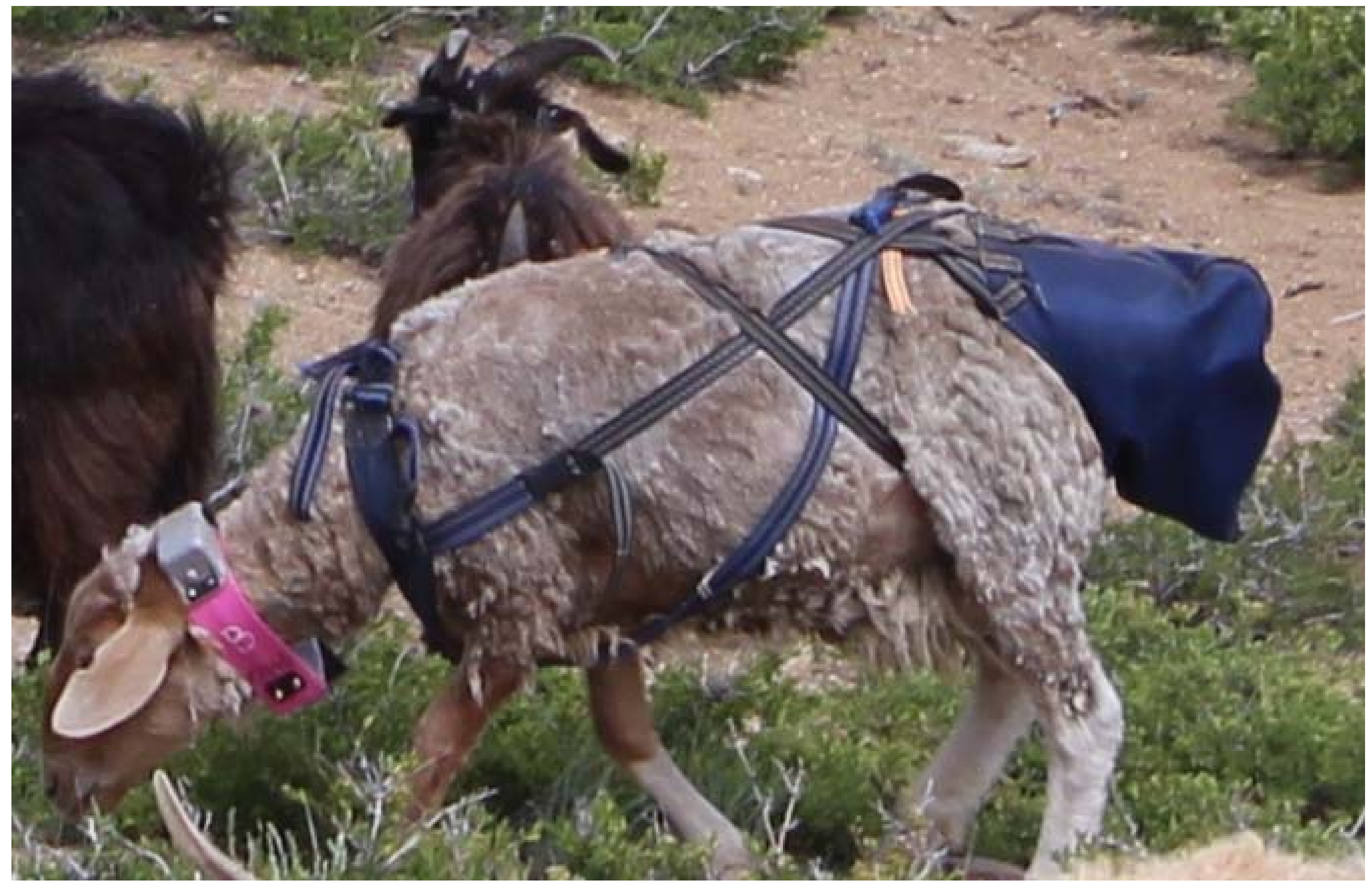
Зураг1. Хоргол цуглуулах уут болон GPS багажаар тоногдсон туршилтын хонь бэлчээрлэж байгаа нь