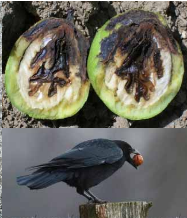
Xanthomonas arboricola pv. juglandis (Bakteriose)