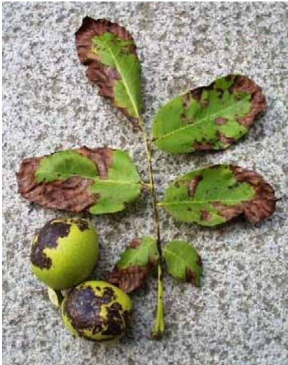
Marssonina juglandis (Pilz)