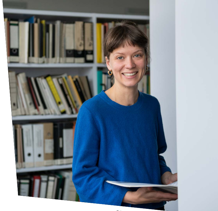
Bibliothek Uni Kassel

Neben der Einführung in die Geschichte, Theorien, Konzepte, Methoden und ethischen Grundlagen der Sozialen Arbeit werden Grundlagen der Erziehungswissenschaft, Soziologie, Psychologie, Politikwissenschaft und Rechtswissenschaft vermittelt. Die Studierenden werden dazu befähigt, wissenschaftliches Wissen mit professioneller Praxis zusammenzubringen und somit reflexiv und gesellschaftskritisch Problemlösungen in den Handlungsfeldern der Sozialen Arbeit zu entwickeln. Je nach Interesse können die Bereiche Bildung, Erziehung, Therapie, Rehabilitation und soziale Hilfen vertieft werden. Einen wichtigen Beitrag zur Berufsorientierung leistet die umfassende Praxisphase (Berufspraktische Studien). Die Hälfte dieser Praxisphase kann mit einem Forschungsschwerpunkt absolviert werden (Lehrforschung). Die in Hessen für die staatliche Anerkennung als Sozialarbeiter:in erforderlichen weiteren Praxiszeiten werden postgradual, also nach dem Bachelor-Abschluss, absolviert.