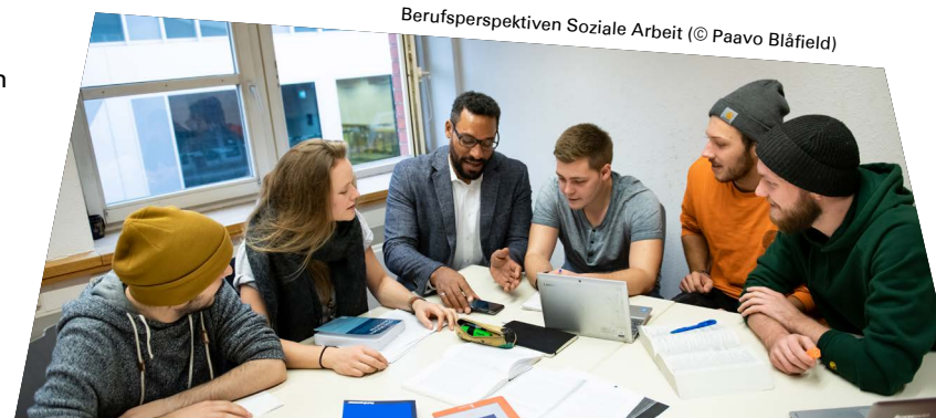
Berufsperspektiven Soziale Arbeit