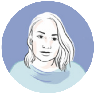
Illustration Visuelles Konzept, Farbgebung und Zeichnungen