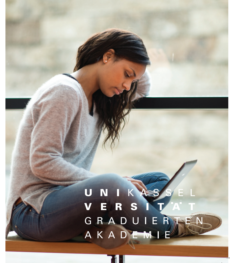
Gestaltung: Universität Kassel: Gianna Dalfuß / Monique Kuhlentkamp