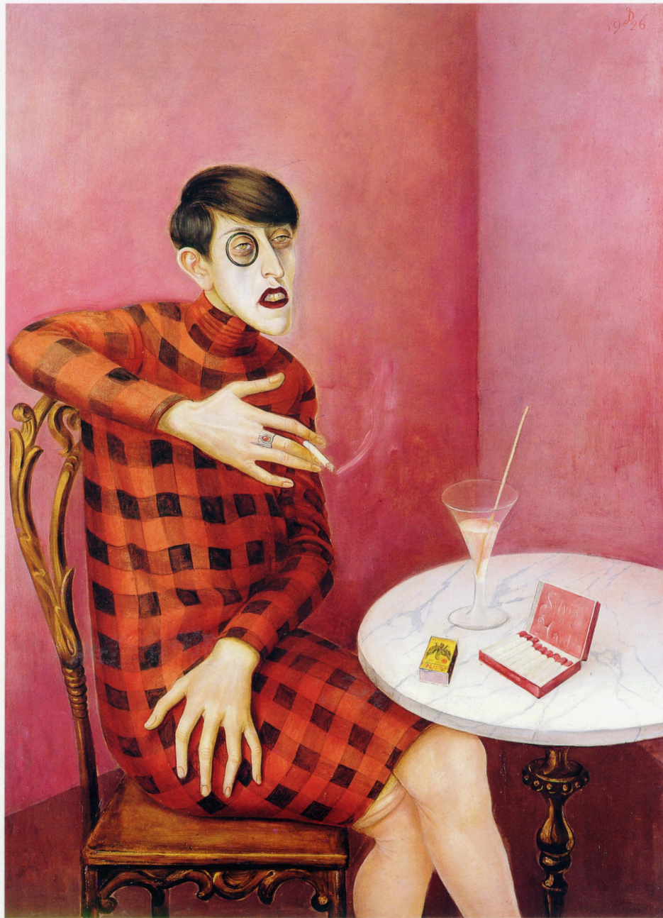
Otto Dix: Bildnis der Journalistin Sylvia von Harden

Mischtechnik auf Holz, 120 x 80 cm, bez. o. r.: Monogramm 1926