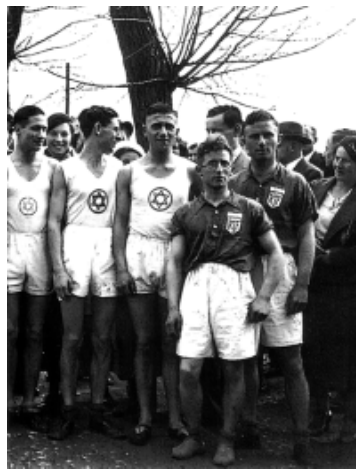
Sportler des Makkabi und des RjF starten in Kassel zum gemeinsamen Waldlauf.

baren Aufschwung in den jüdischen Sportvereinen, da die DT und viele Sportfachverbände Arierparagraphen in Anlehnung an das „Gesetz zur Wiederherstellung des Berufsbeamtentums“ in ihre Satzungen aufnahmen und viele jüdische Sportler ihre alten Vereine verlassen mußten. Die Arbeitersportbewegung bot keine Alternative mehr, da sie bereits im Frühjahr 1933 zerschlagen worden war. 82 Der TuS „Bar Kochba“ Kassel wurde im Kasseler Adreßbuch ab der Ausgabe für das Jahr 1934 unter in der Rubrik „Religiöse Vereinigungen“ geführt, bis 1938 alle jüdischen Organisationen – mit Ausnahme der Reichsvereinigung der Juden in Deutschland – verboten wurden. 83