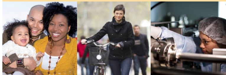
Stand: 2011-09